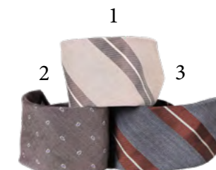
1 Canali, Slips 700,- 2 Canali, Slips 700,- 3 Canali, Slips 700,-