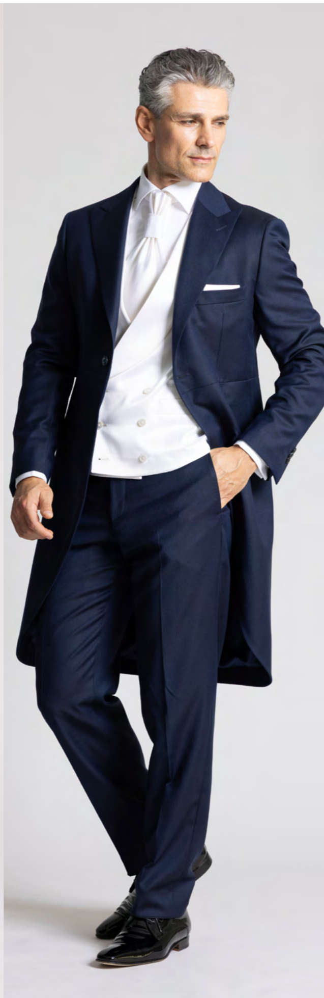
Troelstrup Morningsuit 7.000 kr.