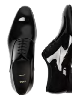
Boss Evening oxford laksko 2.300,-