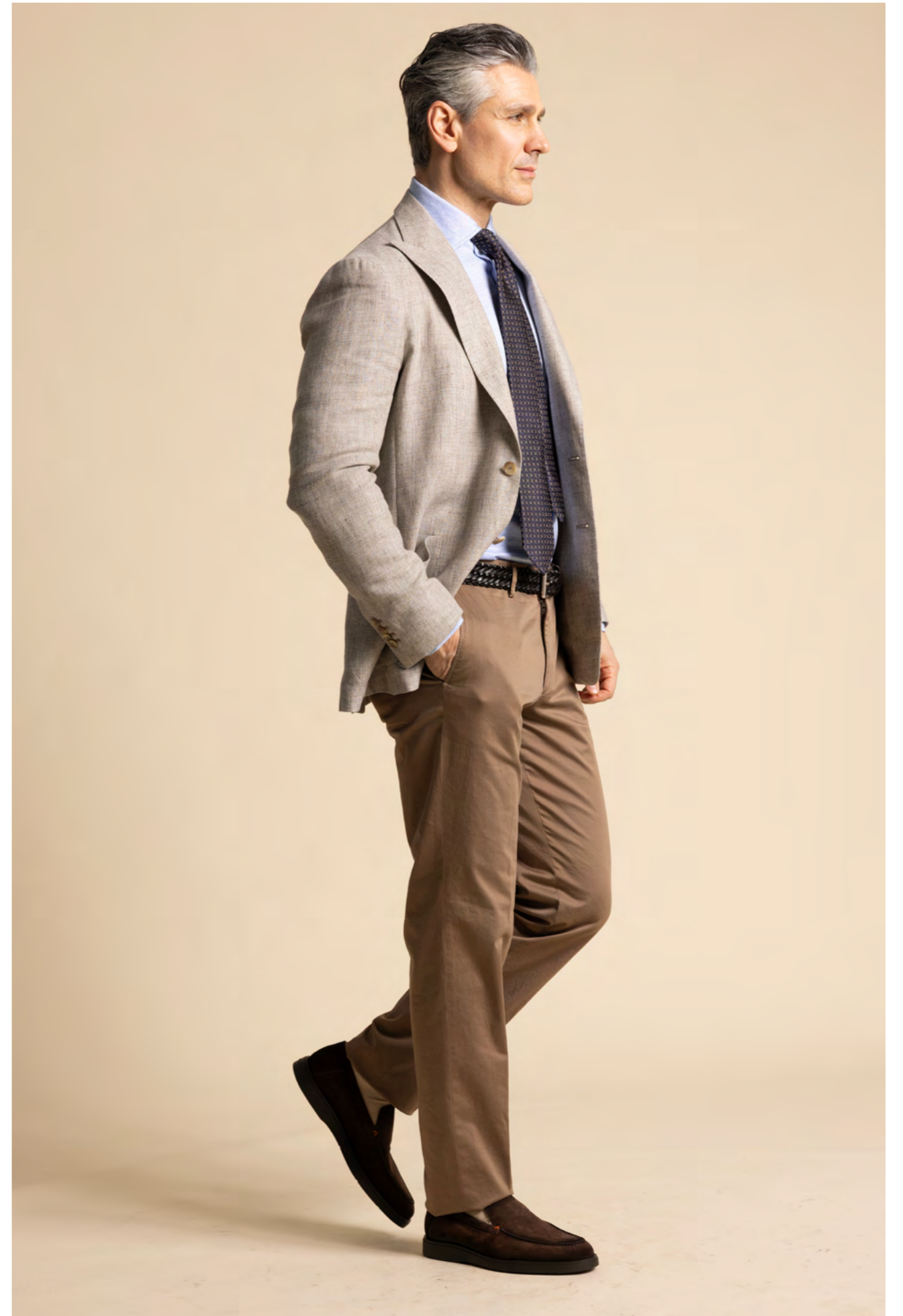
Tagliatore Blazer 5.200 kr.