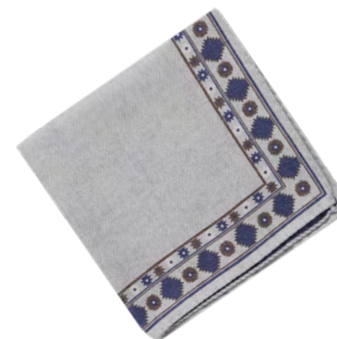
Gierremilano Pochetter 300,-