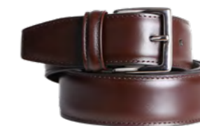
Philipsons Klassisk læderbælte 1.100,-