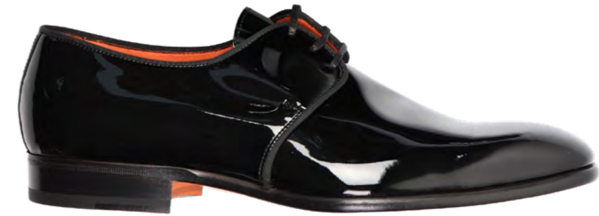
Santoni Evening oxford laksko 5.100,-