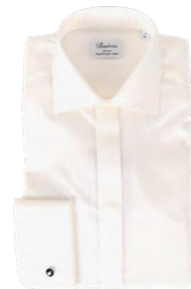
Stenströms Champagnefarvet smokingskjorte 1.300,-