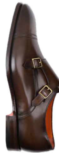
Santoni Læder double monk sko 5.800,-