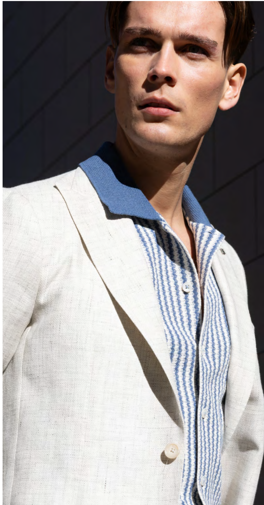
Tagliatore Blazer 5.200 kr.