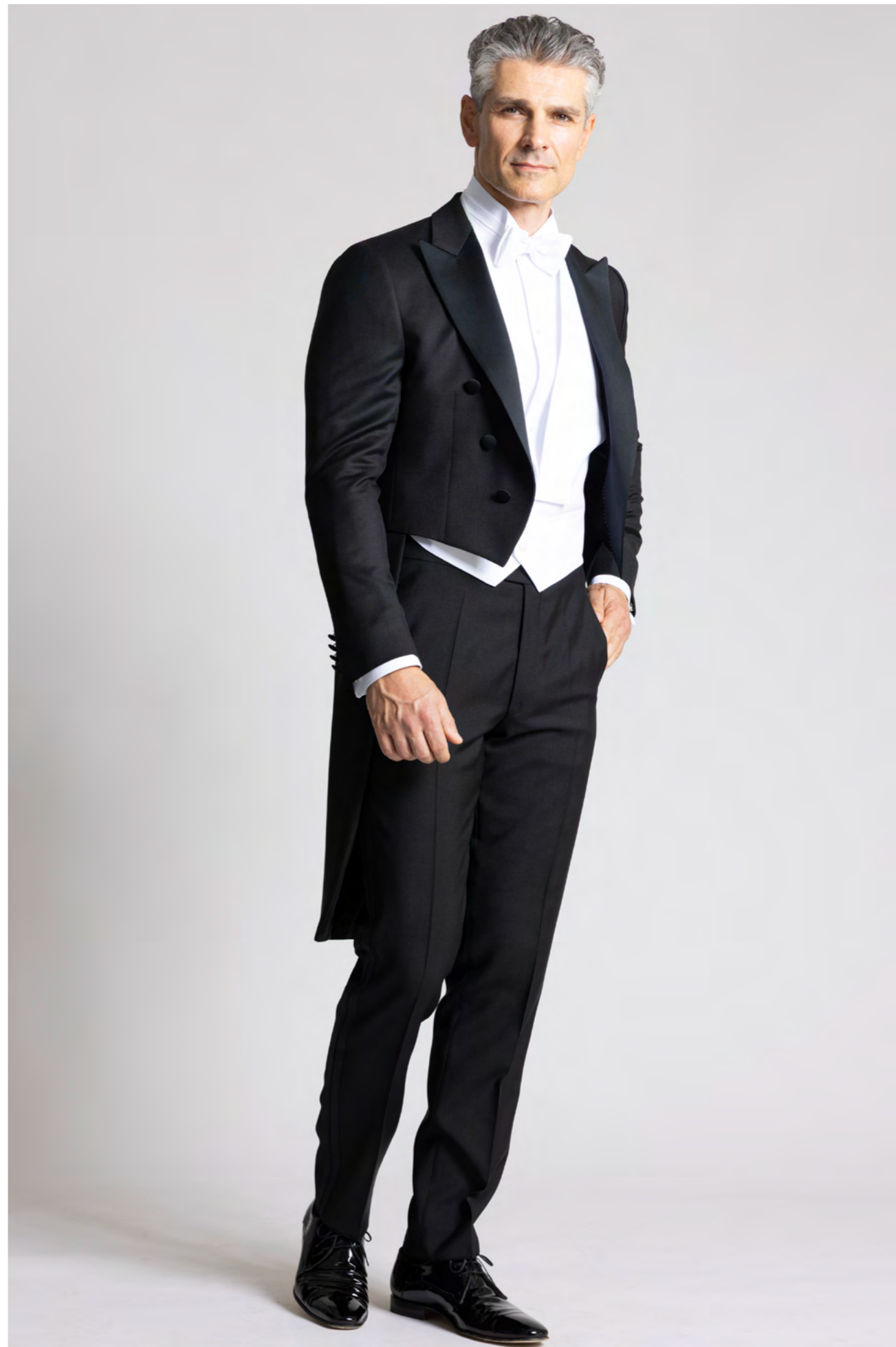
Dressler Kjolesæt 9.000 kr.