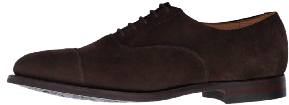
Crockett & Jones Ruskinds oxford sko 4.600,-