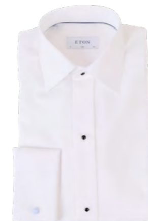
Eton Smokingskjorte 1.700,-