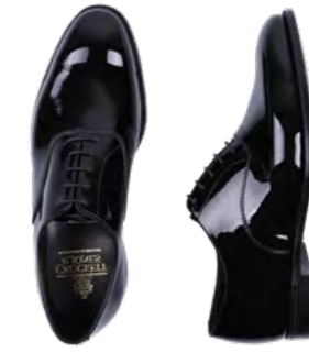
Crockett & Jones Overton laksko 4.900,-