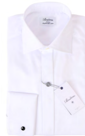
Stenströms Smokingskjorte 1.300,-