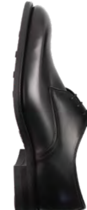
Loake Læder derby 2.900,-