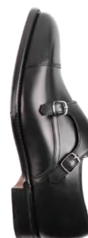
Loake Læder double buckle 3.000,-