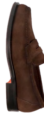
Santoni Ruskinds loafer 4.900,-