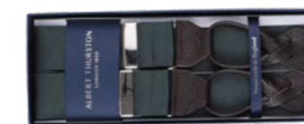
Albert Thurston Bred moire seler 800,-