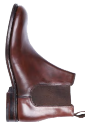
Loake Læder støvle 2.900,-