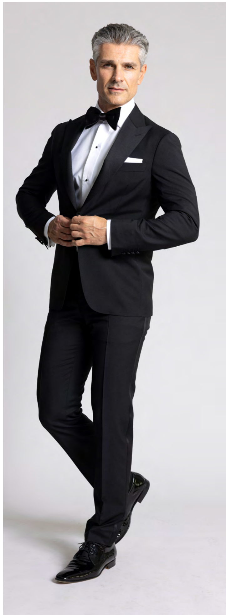
Canali Smoking 11.000 kr.