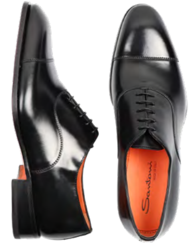
Santoni Læder sko 5.500,-