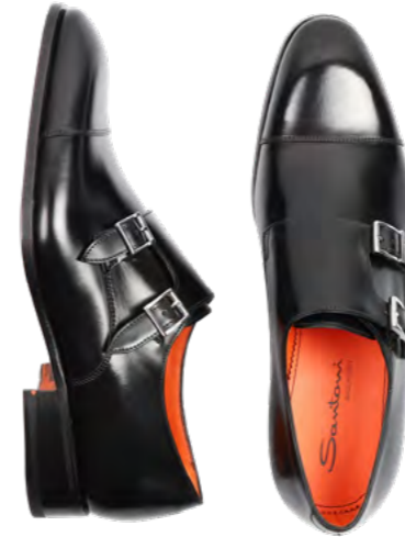
Santoni Læder double monk sko 5.500,-