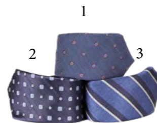
1 Canali, Slips 900,- 2 Canali, Slips 900,- 3 Canali, Slips 900,-