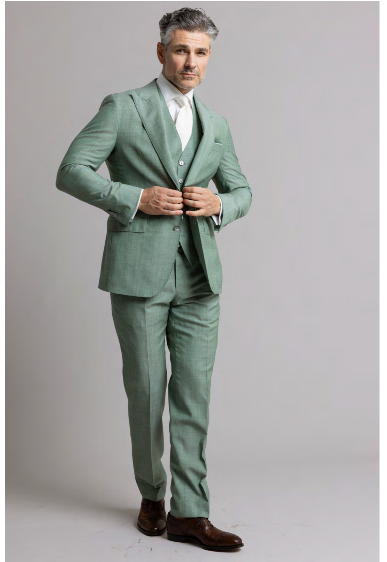
Custom made by Troelstrup Jakkesæt m. vest 9.000 kr.