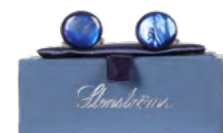
Stenströms Manchetknapper 700,-