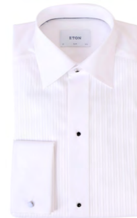
Eton Smokingskjorte 1.700,-