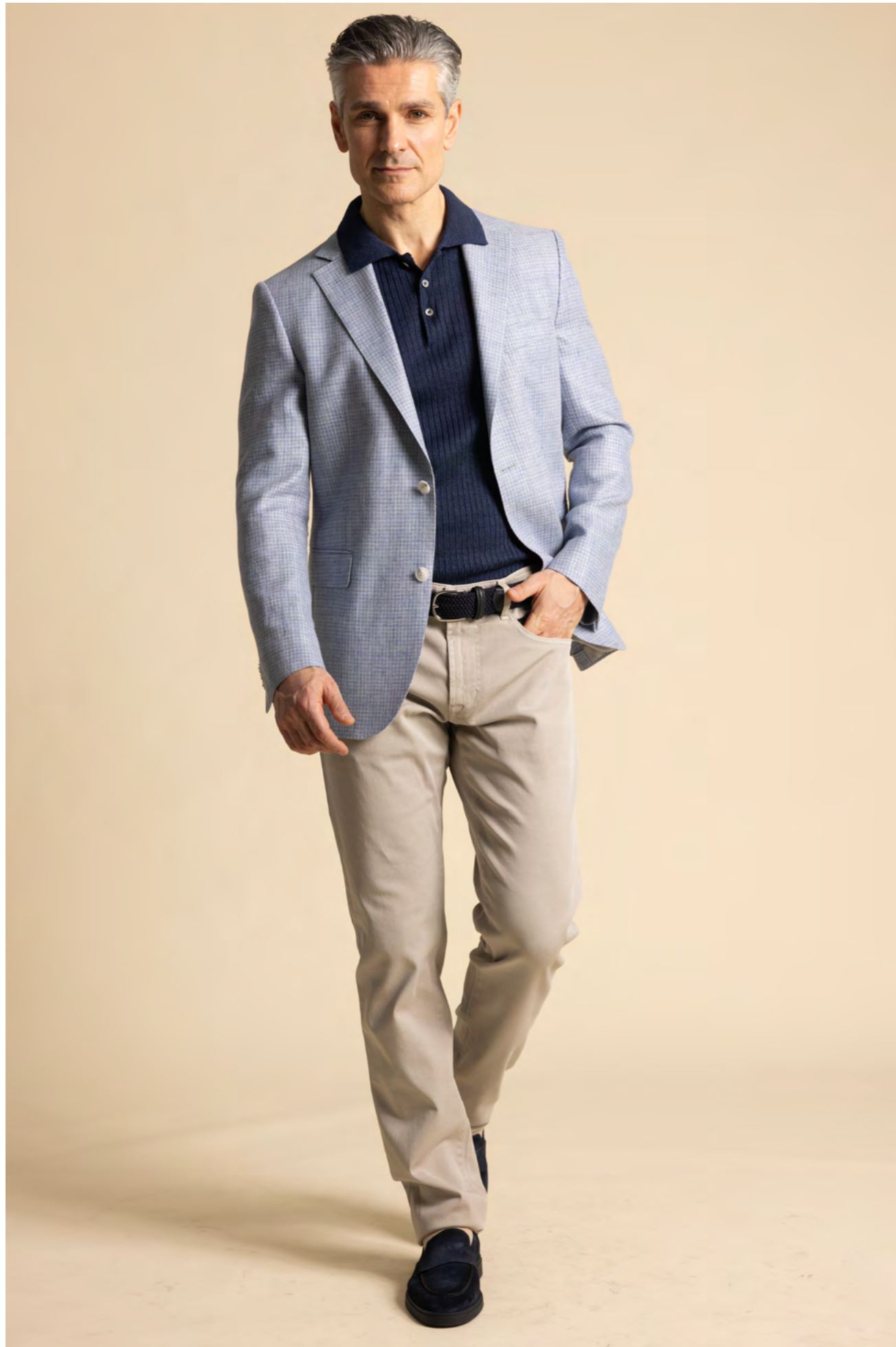
Dressler Blazer 5.000 kr.