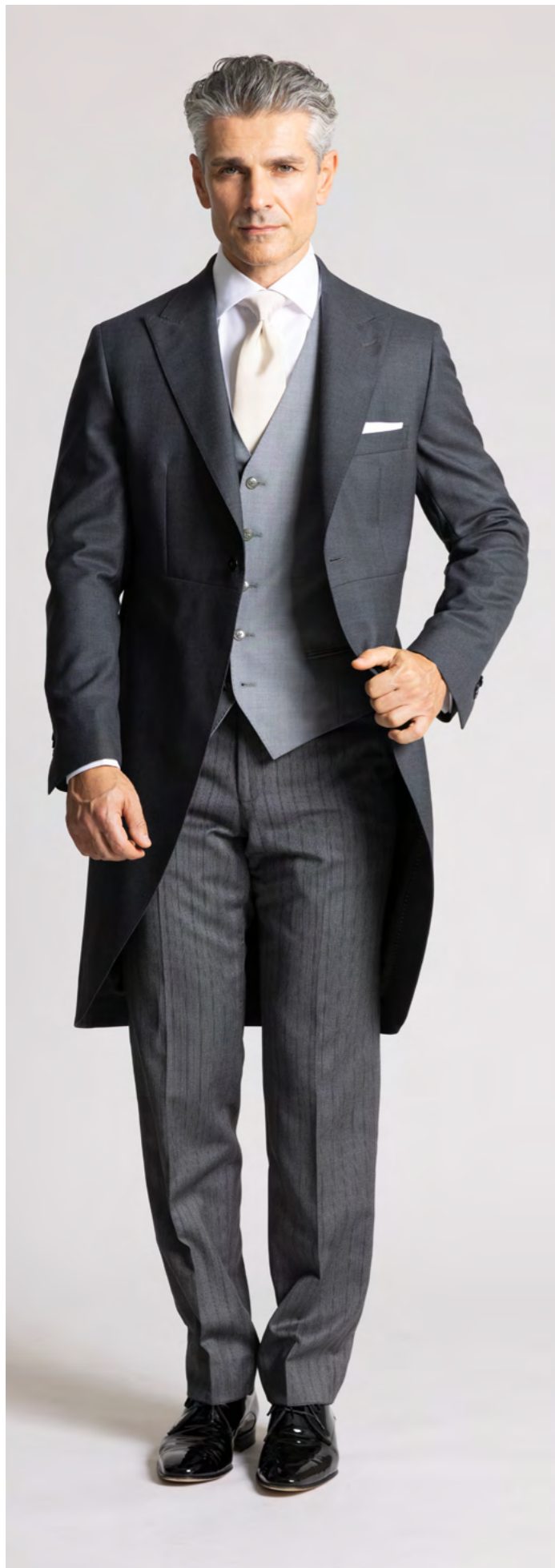
Troelstrup Morningsuit 8.500 kr.