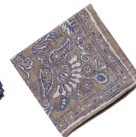
Gierremilano Pochetter 300,-