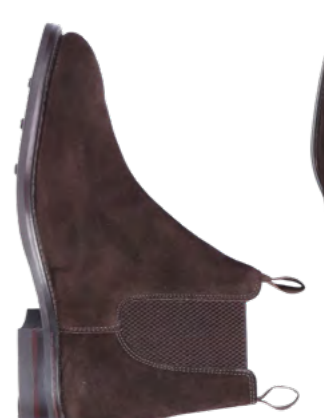
Loake Ruskind's støvle 2.600,-