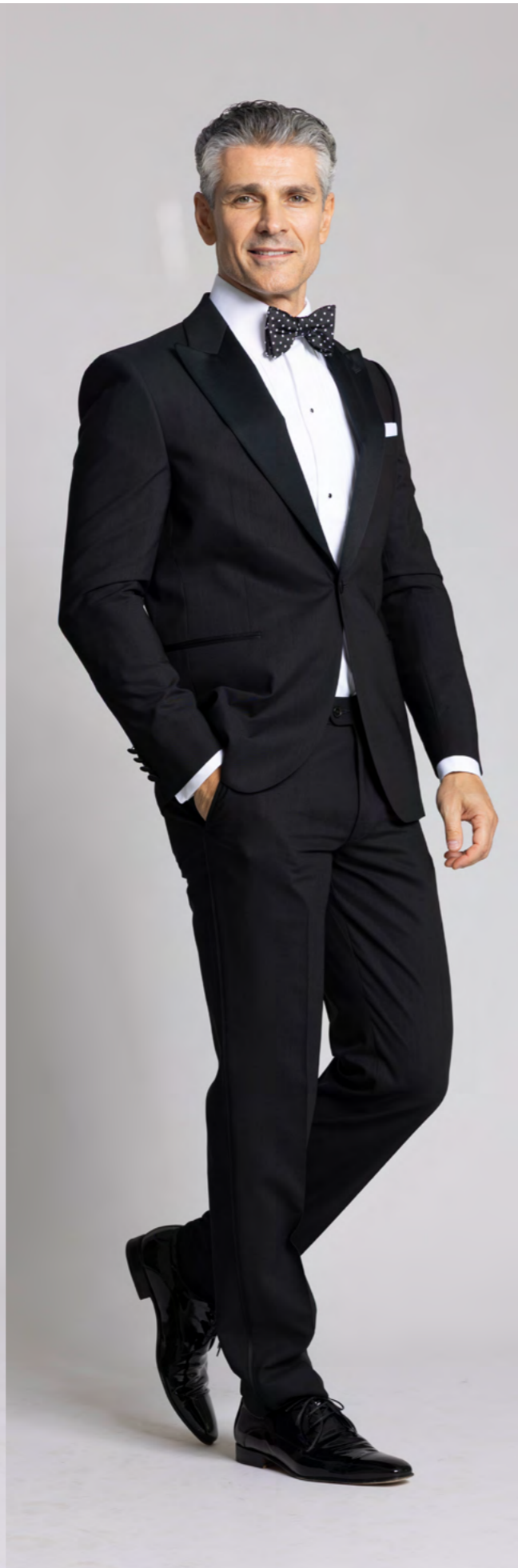
Dressler Smoking 7.200 kr.