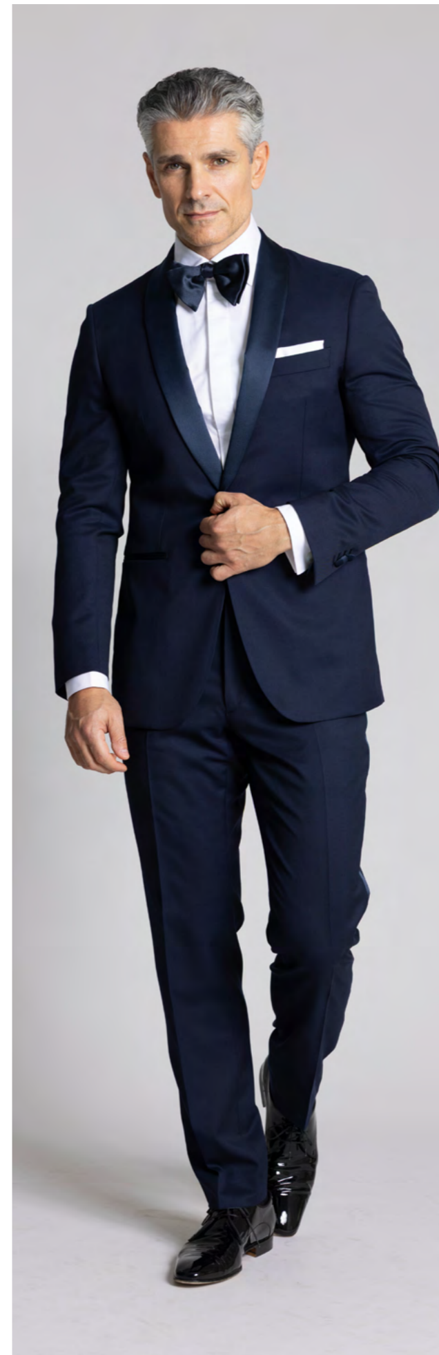
Troelstrup Smoking 6.500 kr.

Et af de spørgsmål, vi ofte får, er: "Hvad er forskellen på en smoking og et jakkesæt?" Læs videre for at lære mere om, hvad du skal vælge til din store dag. Smokingen har silkerevers. Smokingbukser har ingen bæltestropper. Hvilket skyldes, at man (ifølge kuty-men) aldrig bruger bælte til en smoking. Smokingen har silkedetaljer såsom silkebetrukne knapper, silke ved jakkens lommer og bukserne har en silkegalon på siden. Som tilbehør bruger man butterfly, hvid klud og evt. seler til smokingen. Til smokingen bruger man traditionelt laksko, da disse understøtter tøjets skinnende og glamourøse detaljer i silke.