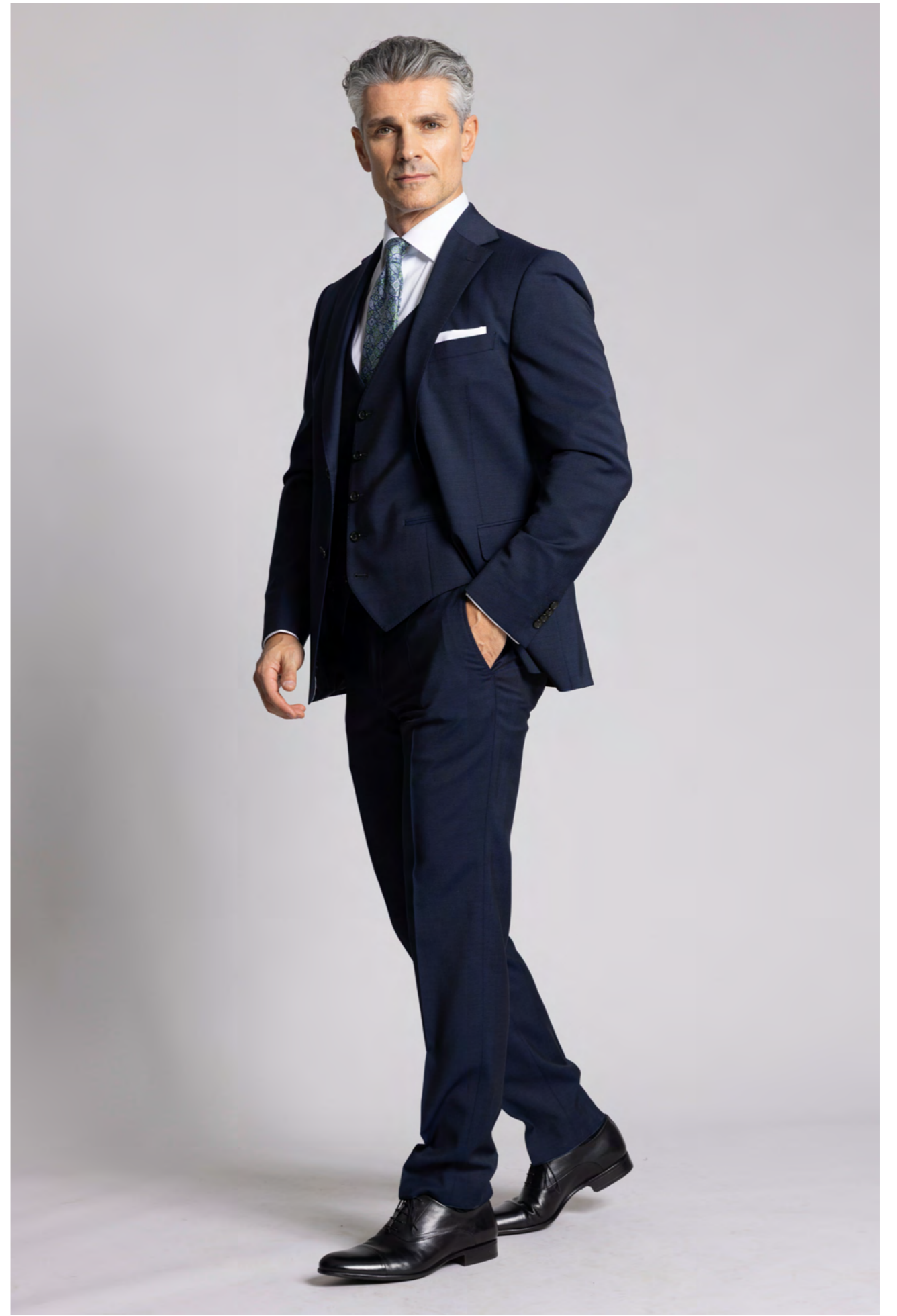
Dressler Jakkesæt m. vest 8.000 kr.