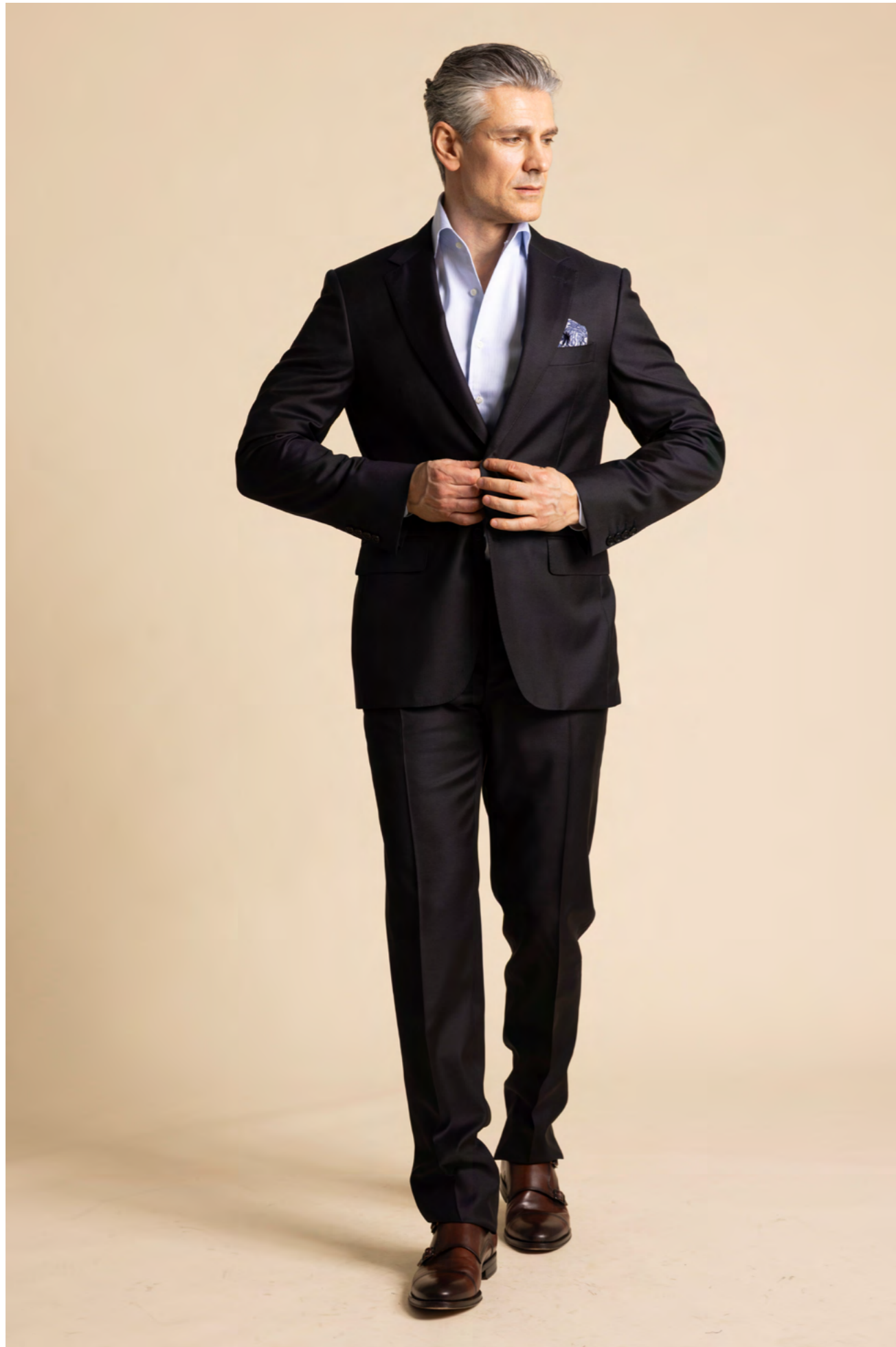
Canali Jakkesæt 11.000 kr.