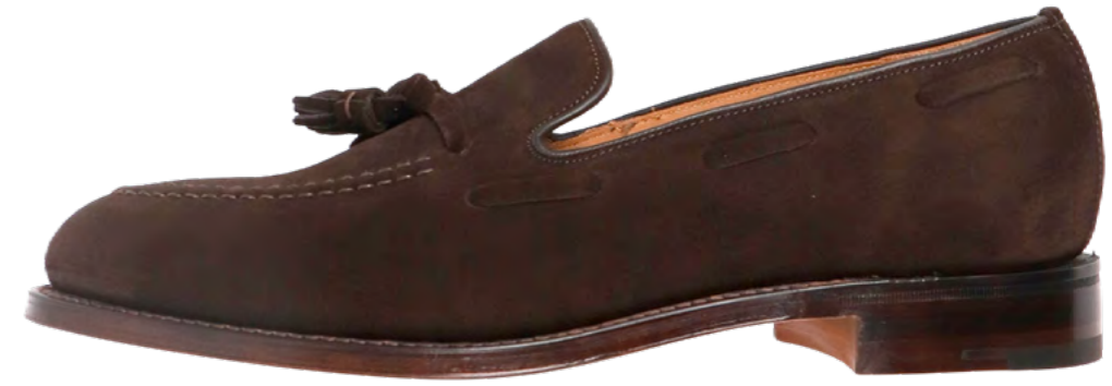
Loake Ruskind's loafer 2.600,-