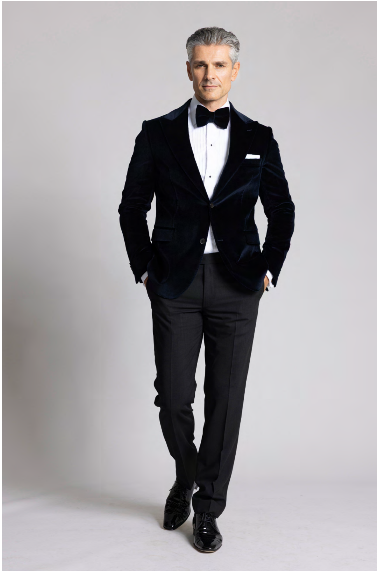
Dressler Velourjacket 5.500 kr.