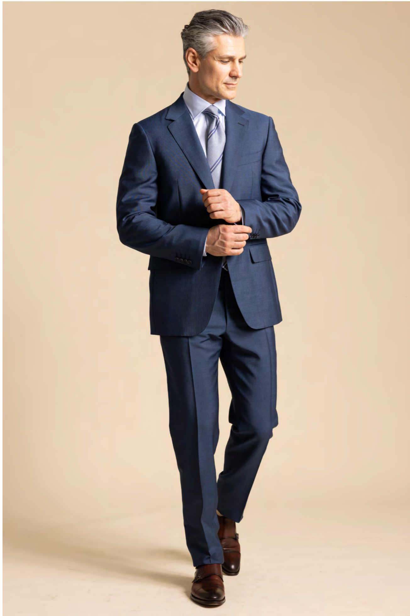
Canali Jakkesæt 12.000 kr.