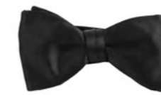
Ascot Wien sløjfe 400,-