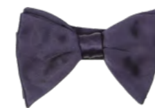
Ascot Montecarlo drip butterfly 400,-