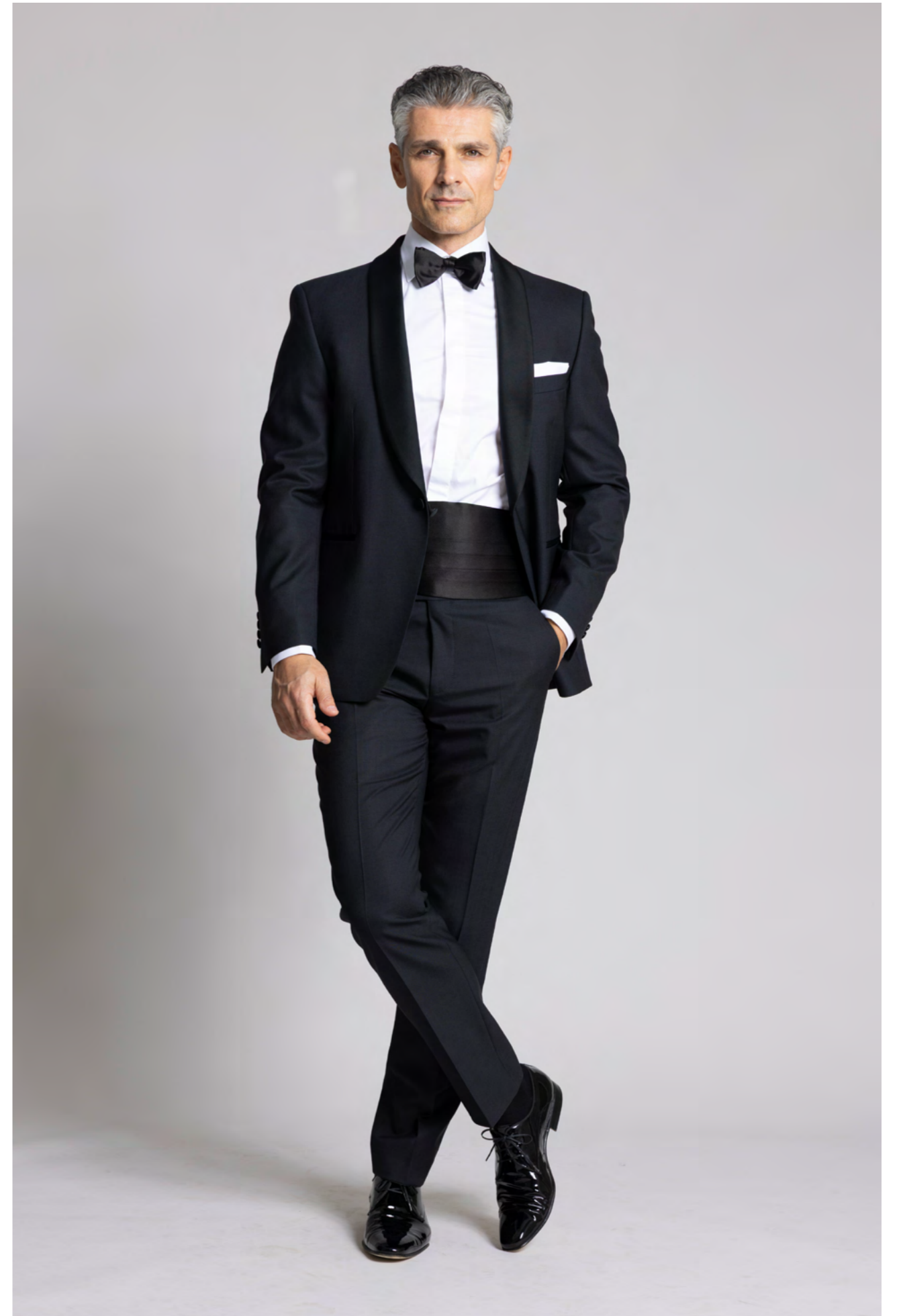
Wilvorst Smoking 3.800 kr.