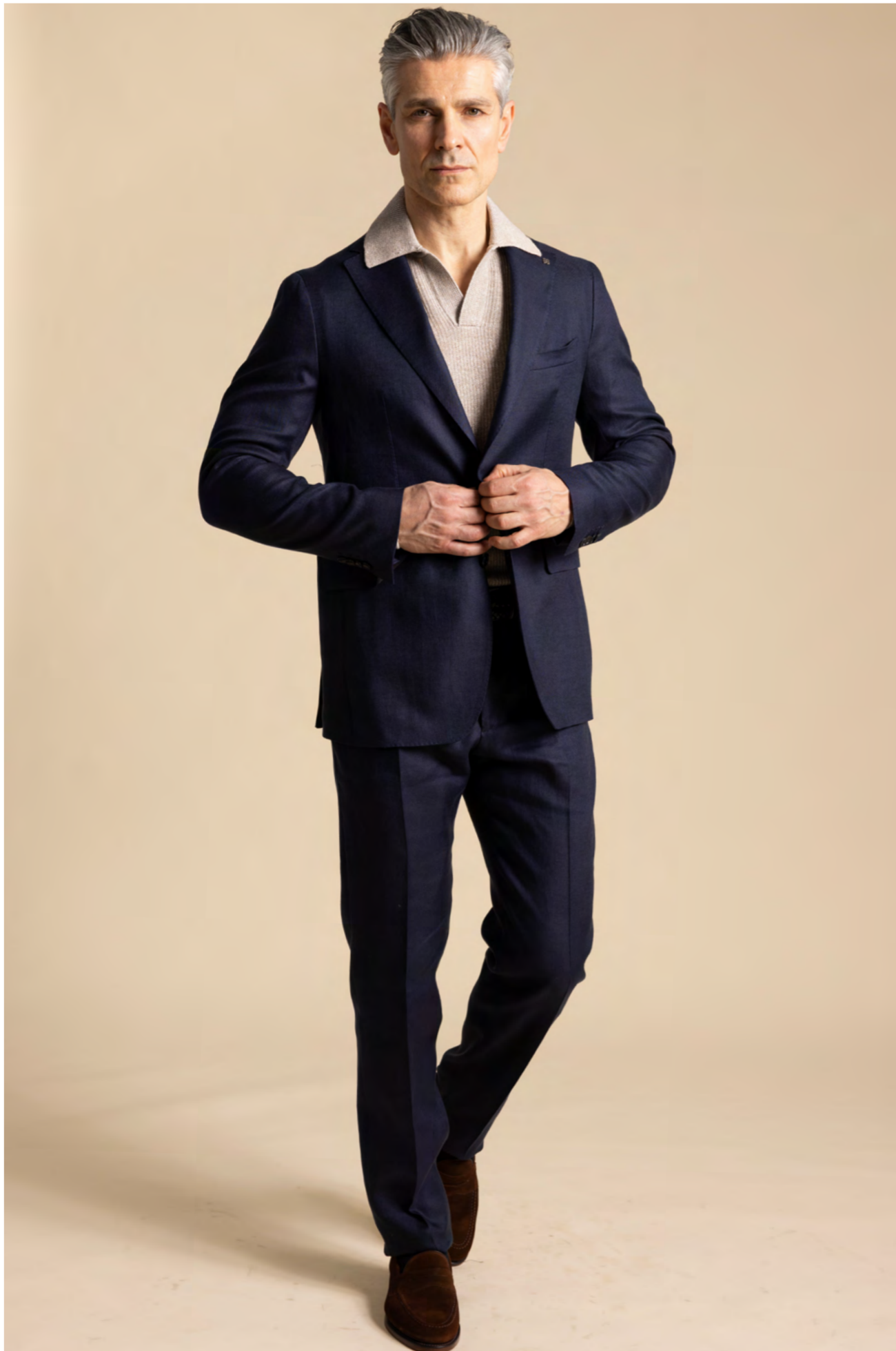
Tagliatore Jakkesæt 7.000 kr.