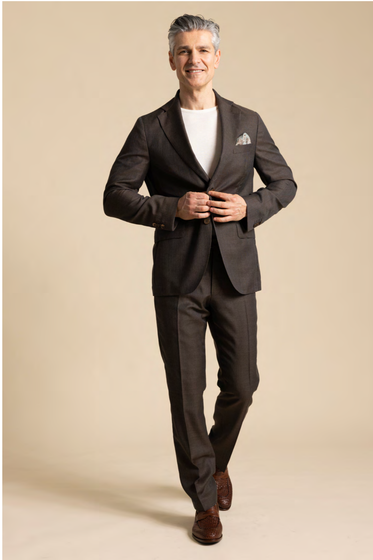
Oscar Jacobson Jakkesæt 5.300 kr.