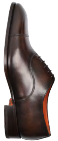
Santoni Læder sko 5.500,-