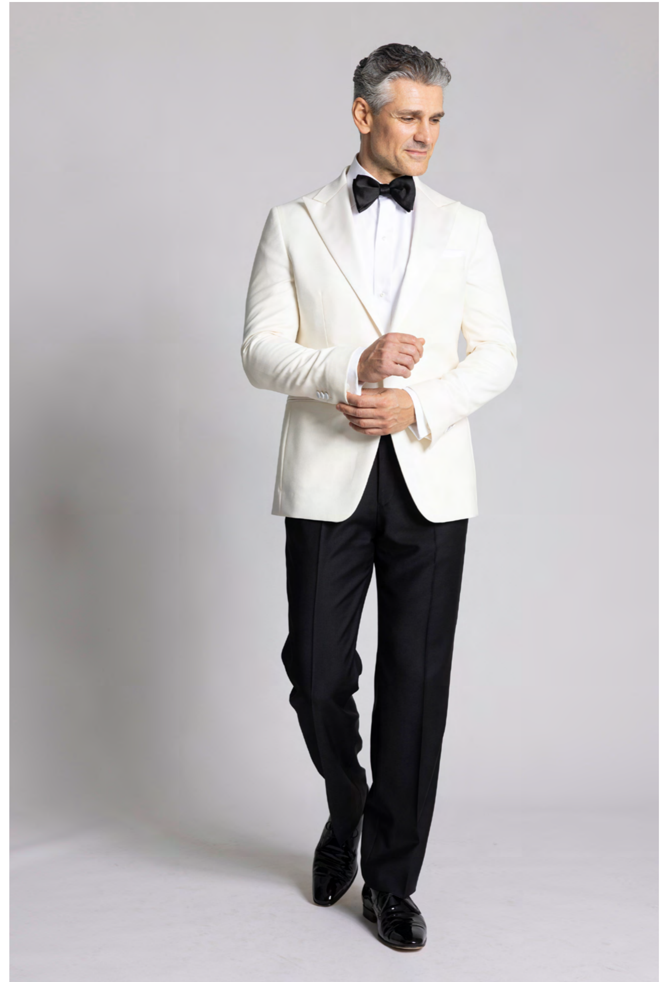
Troelstrup Dinnerjacket 4.800 kr.