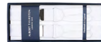
Albert Thurston Moire seler smal 750,-