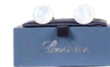
Stenströms Manchetknapper 700,-