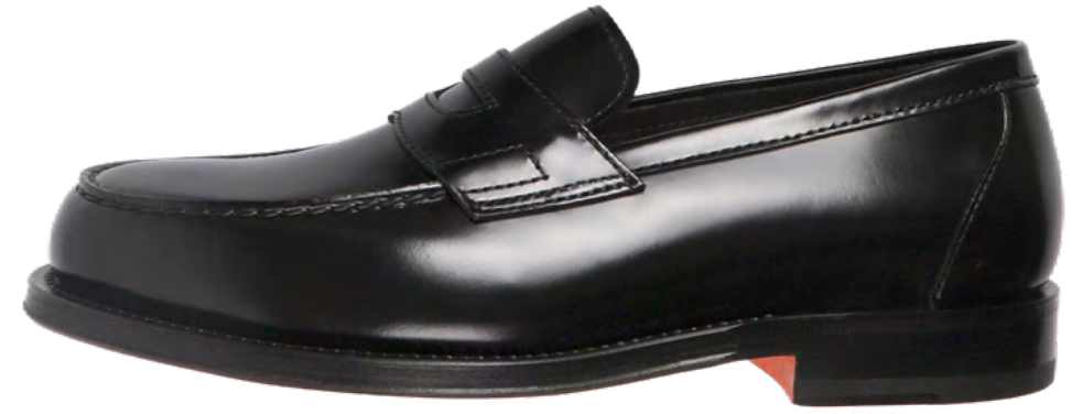
Santoni Læder loafer 5.900