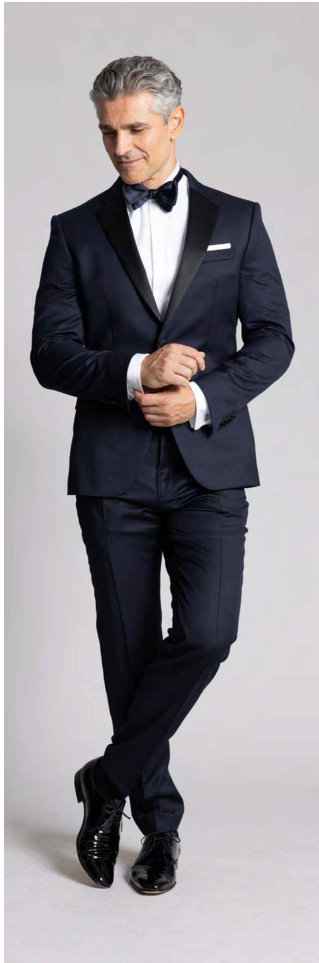
BOSS Smoking 6.500 kr.