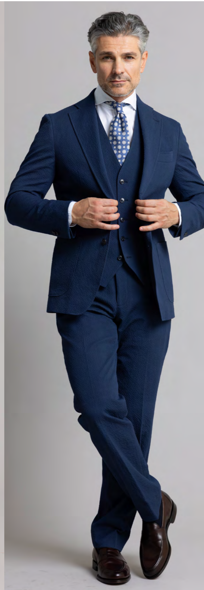
Custom made by Troelstrup Jakkesæt m. vest 9.000 kr.