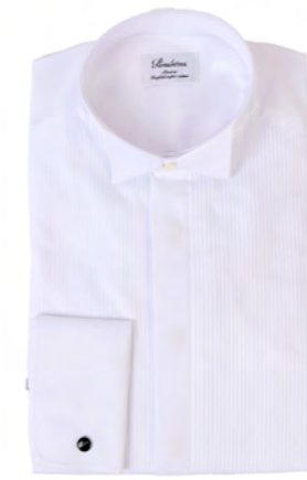
Stenströms Smokingskjorte m. knækflip og plisse 1.500,-