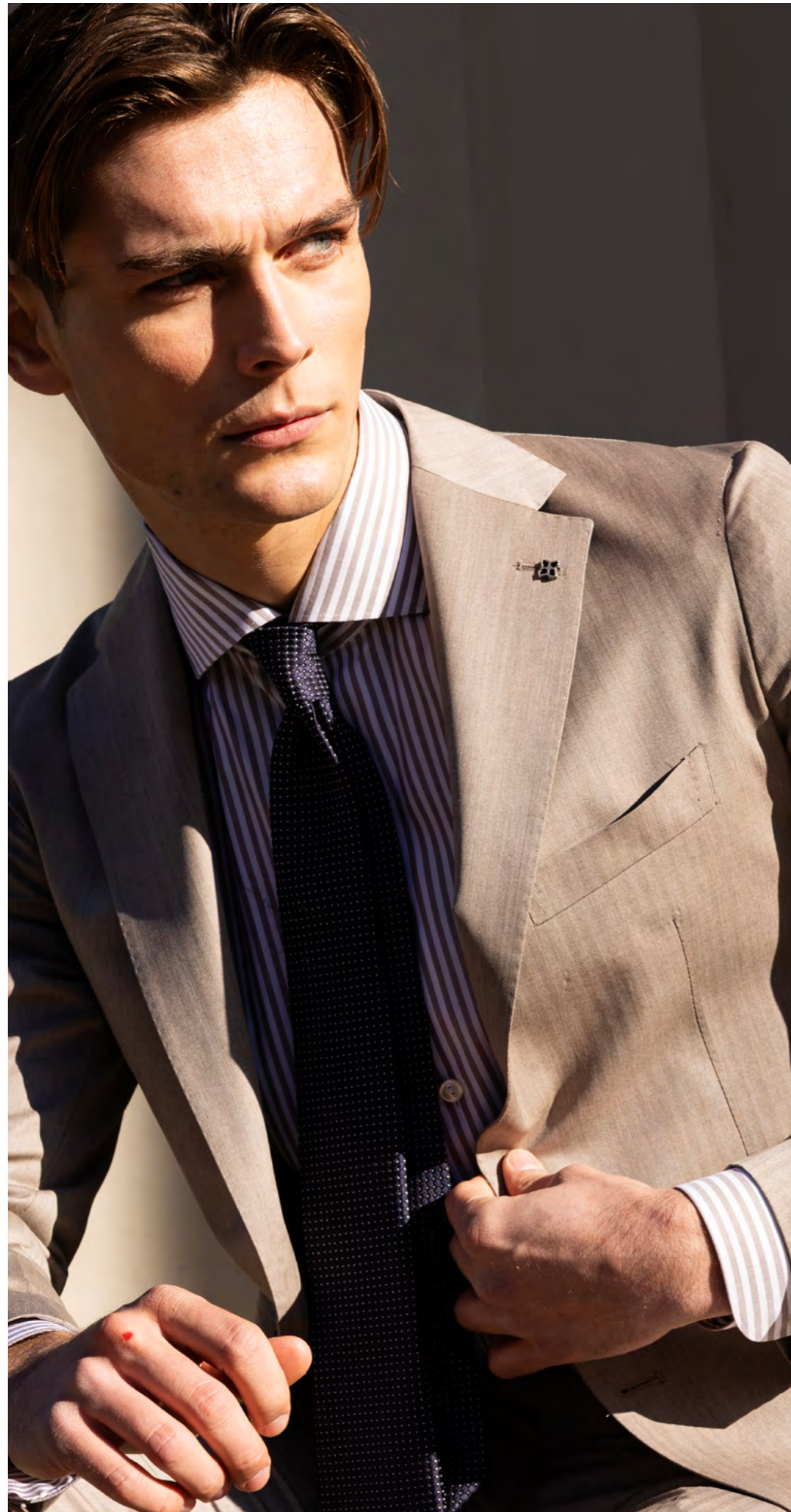
Tagliatore Jakkesæt 7.000 kr.