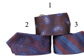
1 Canali, Slips 1000,- 2 Canali, Slips 1000,- 3 Troelstrup, Slips 600,-