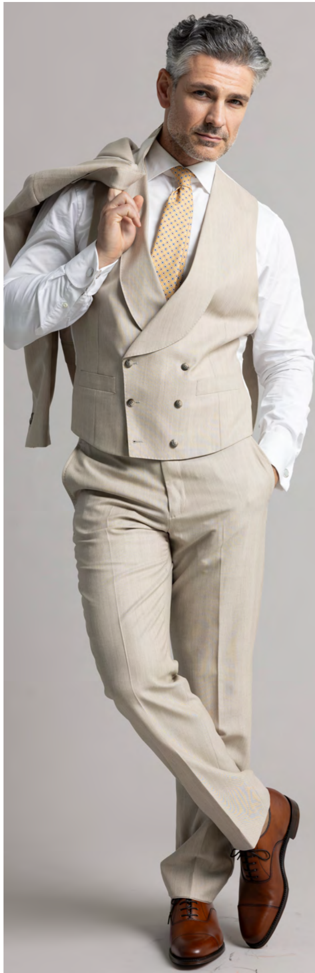
Custom made by Troelstrup Jakkesæt m. vest 9.600 kr.