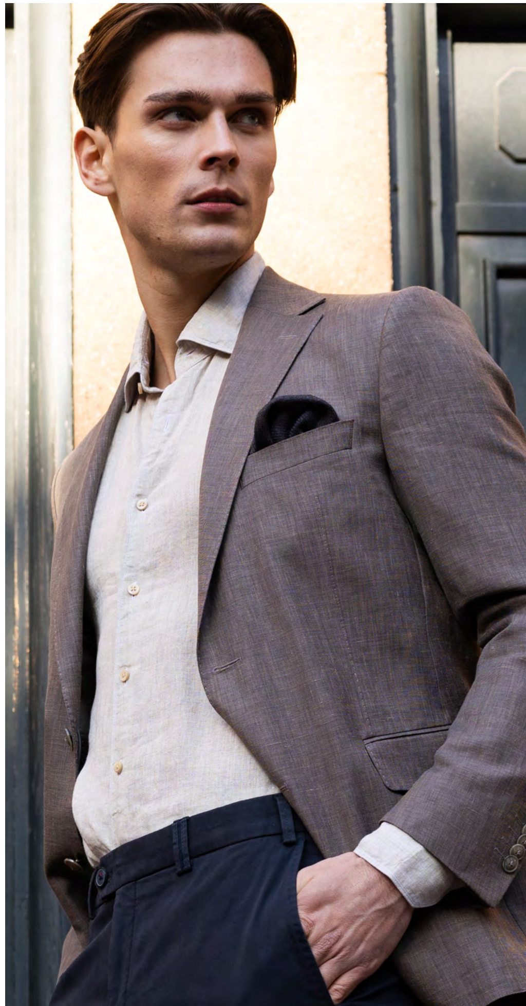
Dressler Blazer 5.900 kr.