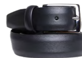
Anderson´s Mat læderbælte 1.100,-