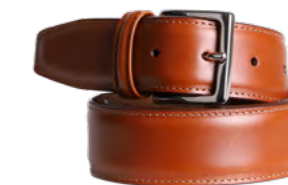
Anderson´s Klassisk læderbælte 1.100,-