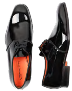
Santoni Moore derby laksko 5.100,-