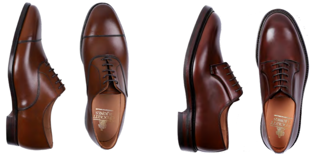
Crockett & Jones Læder oxford sko 5.600,-