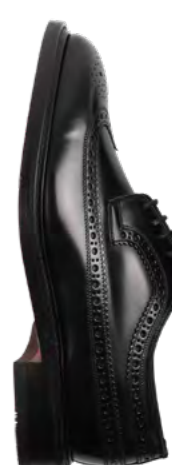
Loake Læder derby 2.600,-