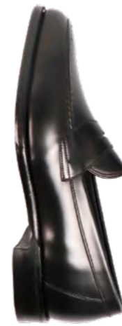
Loake Læder loafer 3.000,-