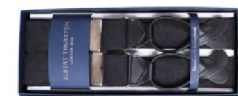
Albert Thurston Seler med læderstrop 1.200,-