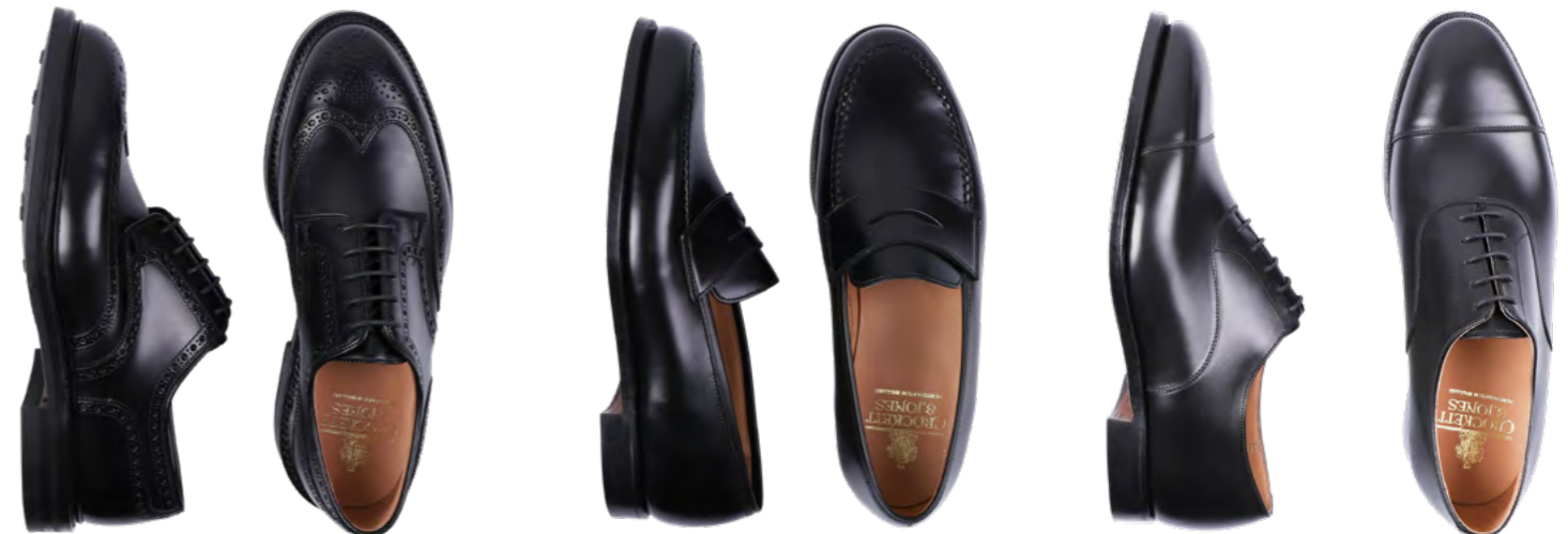
Crockett & Jones Læder derby sko 5.500,-